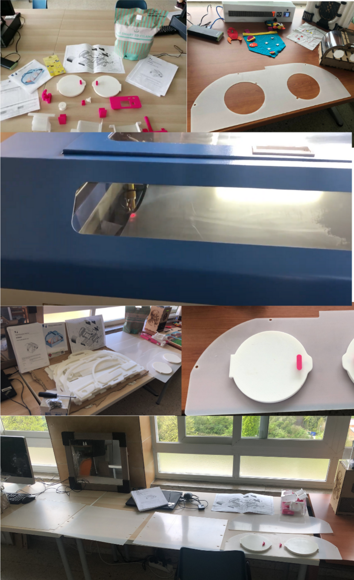
Proceso de impresión- Corte láser