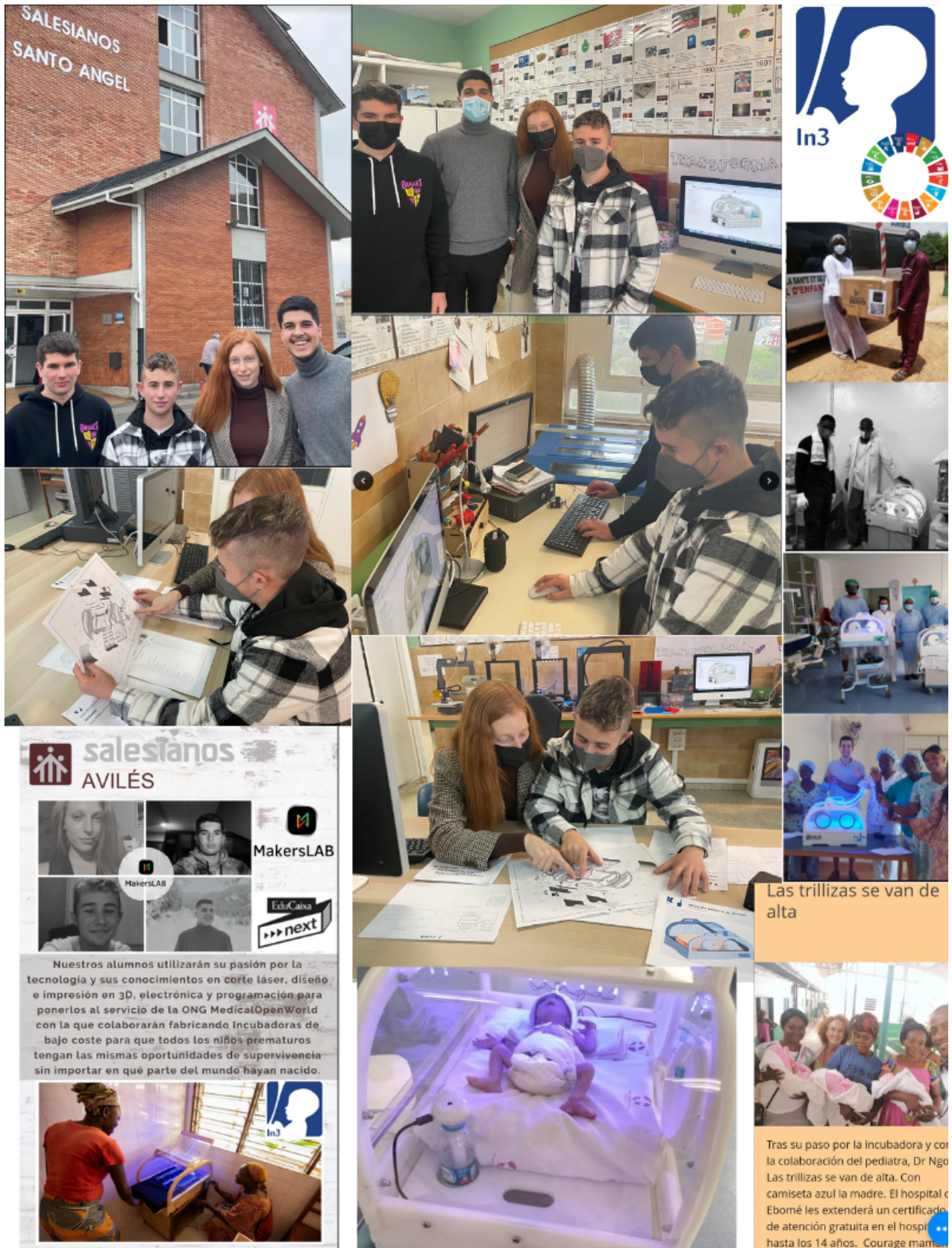
Equipo MakersLab- Motivación - Proyecto