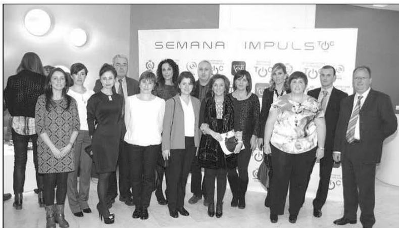
Foto de familia de los candidatos a los premios.