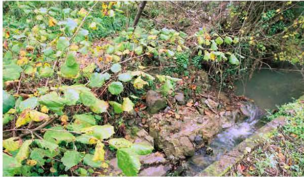
El cauce del río Cenera, ayer, parcialmente taponado, por los restos del muro.

Los vecinos de Cenera temen que la falta de limpieza afecte a unas torres de alta tensión