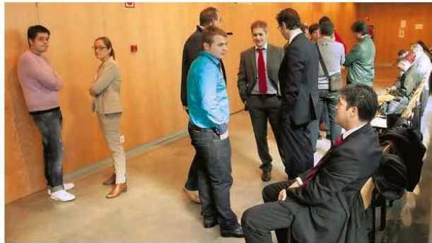
Los implicados, a las puertas del juzgado el mes pasado.

Sin embargo, la sentencia de la Sección Segunda de la Audiencia Provincial recalca que «esas cuestiones pueden hacer sospechar su implicación en los hechos, pero no con la contundencia suficiente para permitir deducirse su participación a título de complicidad». Desacata el fallo que los datos que pudo facilitar la camarera no resultan impresionantes ni de gran relevancia en