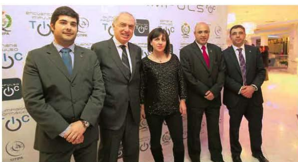
Los representantes de la Red de Telecentros, Telecable y CCIInfor, ayer, en la gala.

TSK continúa con su crecimiento y buena prueba de ello es que prevé aumentar las instalaciones que tiene actualmente en el Parque Científico Tecnológico de Gijón, donde inaugurará en enero un nuevo edificio, anexo al actual, lo cual supondrá unos 200 puestos de trabajo más, que se sumarán a los 350 actuales.