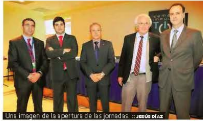
Una imagen de la apertura de las jornadas.

importancia de la industria informática y las TIC. El programa se articula en ponencias, mesas redondas y jornadas puramente técnicas en campos que van desde la aplicación de estas tecnologías a la educación a la ciberseguridad, tanto para ciudadanos como para empresas. Entre los ponentes figura el responsable de alerta temprana del Centro Cibernético Nacional o la Sociedad Regional de Turismo, con una jornada técnica sobre su implementación en el sector.