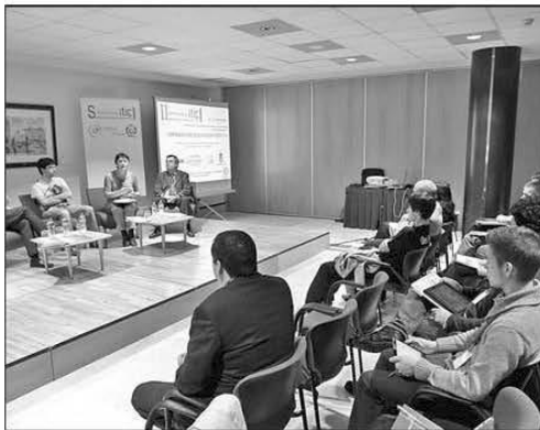
Una ponencia de la edición pasada.