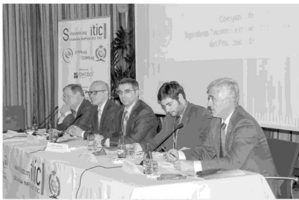
Mesa de presentación de una edición anterior de la Semana Impulso TIC.

GUON A. G. Con el objetivo de fomentar e impulsar el desarrollo y conocimiento de la industria informática o TIC como complemento clave para la mejora del resto de sectores industriales y sociales, Asturias acogerá desde el próximo lunes 18 la III edición de la Semana Impulso TIC. Organizada por los Colegios Oficiales de Ingenieros Técnicos e Ingenieros en Informática del Principado de Asturias, en colaboración con otras entidades, el programa se desarrollará por diferentes localidades asturianas.