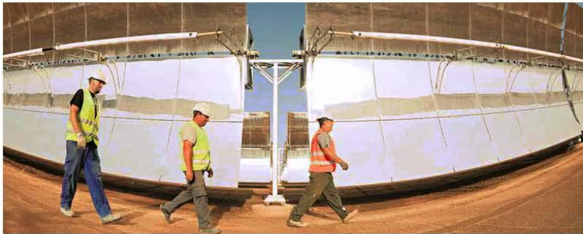
Una de las últimas plantas construidas por la compañía alemana Flagsol, que ha sido adquirida por TSK.