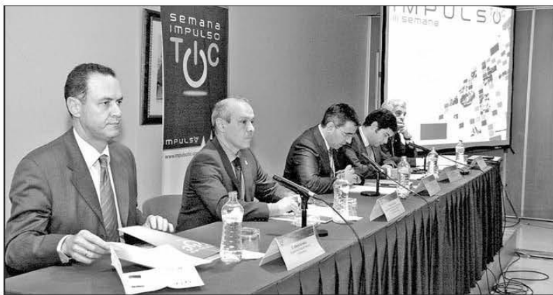
Mesa presidencial durante la inauguración de ayer.

no. Para inscribirse (de forma completamente gratuita) hay que hacerlo en la página www.impulso-tic.org/semana/inscripciones/ .