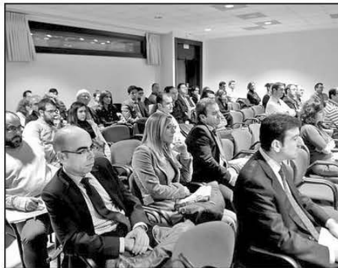
Público asistente a una de las ponencias.